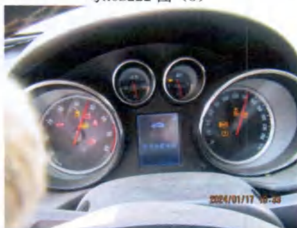
粤K0B222 图 (7)