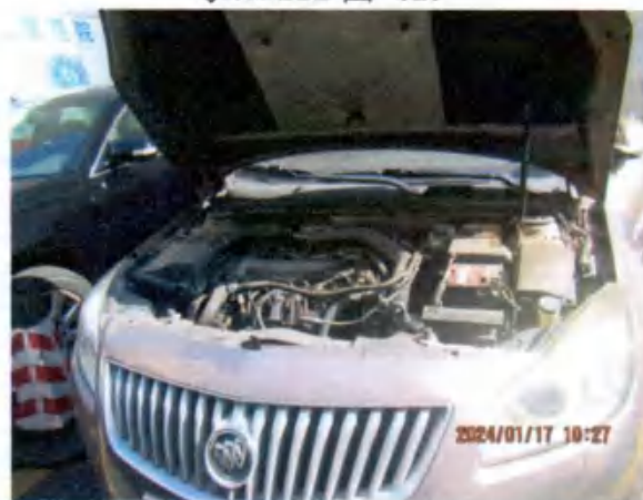
粤K0B222 图 (4)