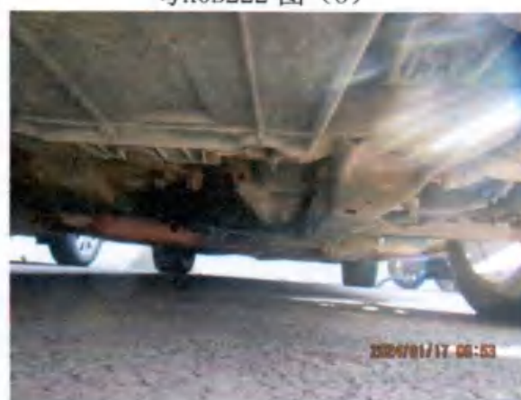
粤K0B222 图 (8)