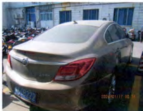
粤K0B222 图 (2)