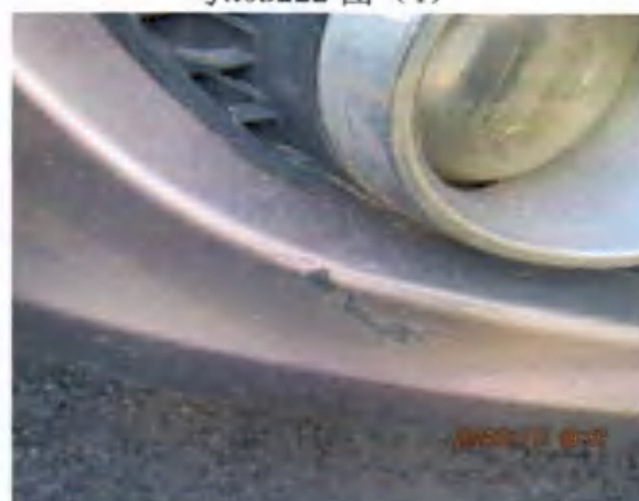
粤K0B222 图 (6)