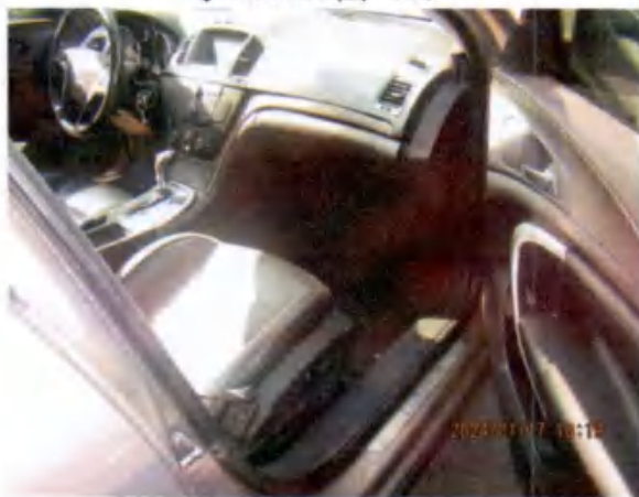
粤K0B222 图 (3)