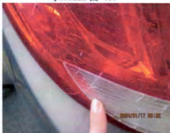
粤K0B222 图 (5)