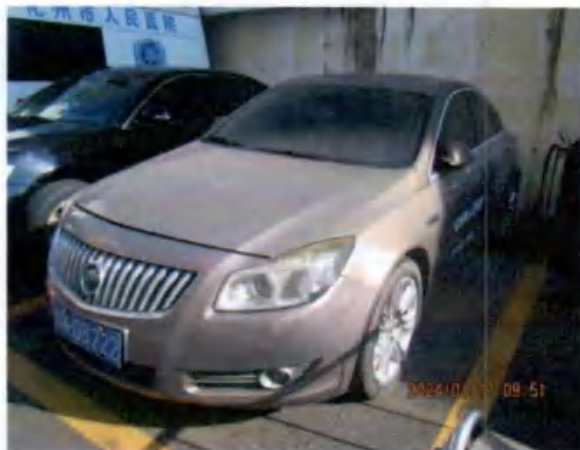
粤K0B222 图 (1)